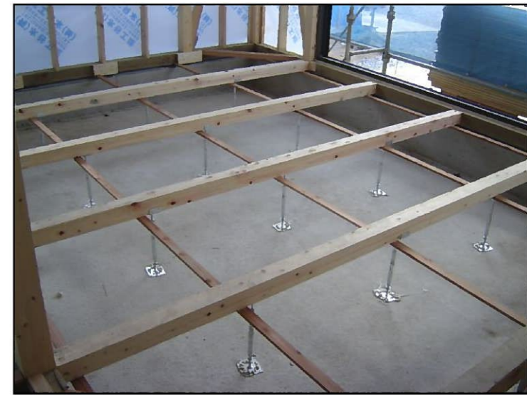
床を支える鋼製束 白蟻対策もバッチリ！