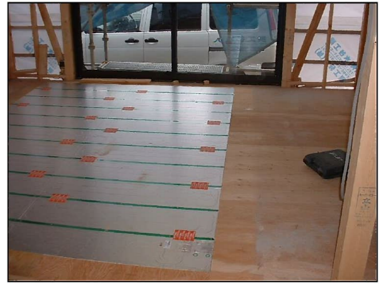
床暖房パネルを敷きました パネルは温水式です