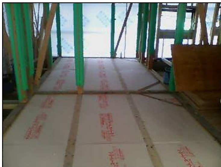
床断熱材を充填して⇒