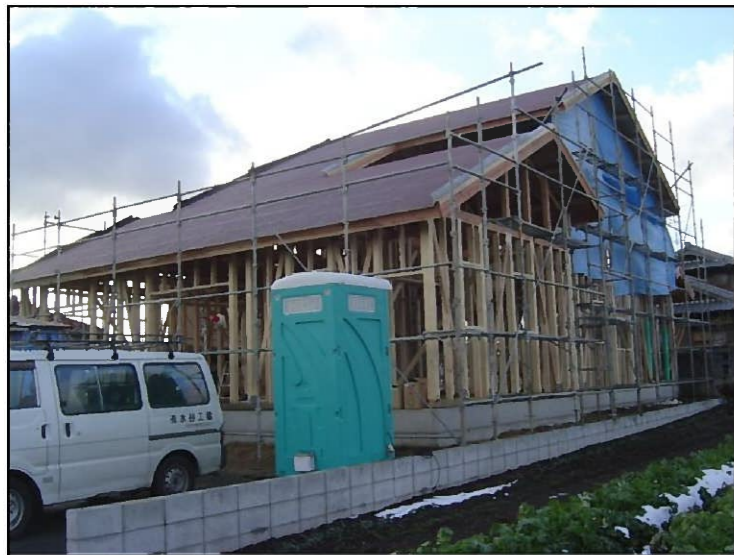
建前直後の外観です デッケ～！！